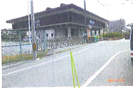
北側駐車場出入口